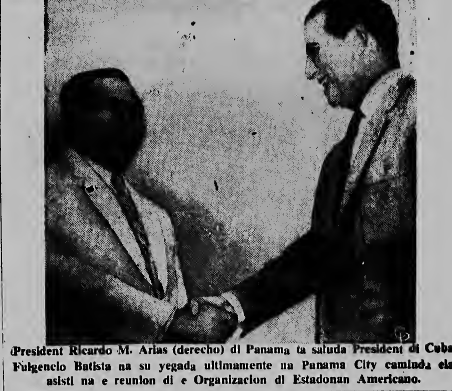
President Ricardo M. Arias (derecho) di Panama ta saluda President di Cuba Fulgencio Batista na su yegada ultimamente na Panama City caminda el a asisti na e reunion di e Organizacion di Estadonan Americano.